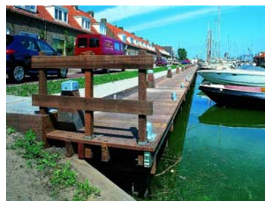
FSC-gecertificeerde massaranduba dekdelen te Monnikendam.

Houtinformatielijn, tel: 0900 5329946 (€ 0,15 p/m) of houtinformatie@centrum-hout.nl